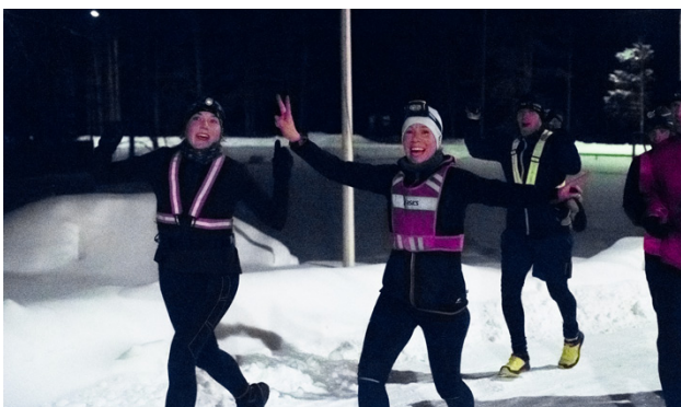
Humöret var på topp bland deltagarna på Ultra Intervall Camp.